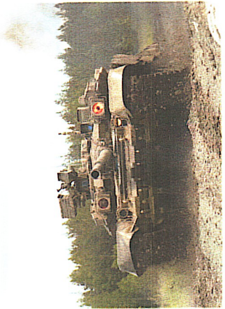
Занятие по вождению танков