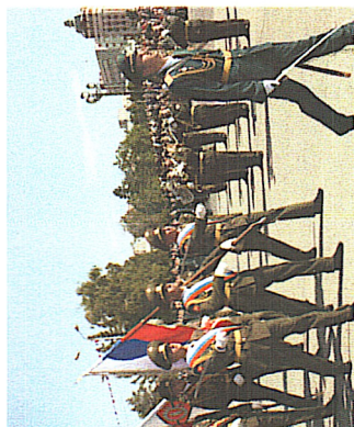
Боевое Знамя Института

С кандидатами, зачисленными в институт курсантами, заключается контракт на время обучения и 5 лет военной службы после окончания. Каждый выпускник получает водительское удостоверение на право управления автомобилем категорий «В» и «С», а курсанты, обучающиеся на специальностях бронетанкового направления, также удостоверяются механика-водители Гусеничной машины.