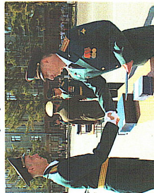
Выпуск молодых офицеров